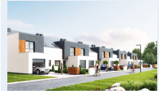
Widok od strony ulicy