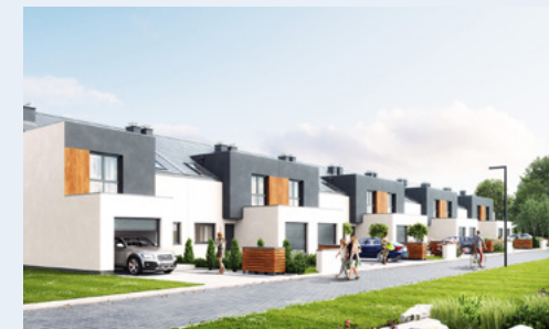
Widok od strony ulicy

NR POMIESZCZENIE POWIERZCHNIA 1 Wiatrołap 3,05 m 2 2 Kuchnia 12,66 m 2 3 Pokój dzienny 37,14 m 2 4 Toaleta 2,84 m 2 5 Schody 2,77 m 2 6 Garaż 17,73 m 2 7 Kotłownia 1,90 m 2 Powierzchnia użytkowa 78,09 m 2 Powierzchnia działki 279,00 m 2